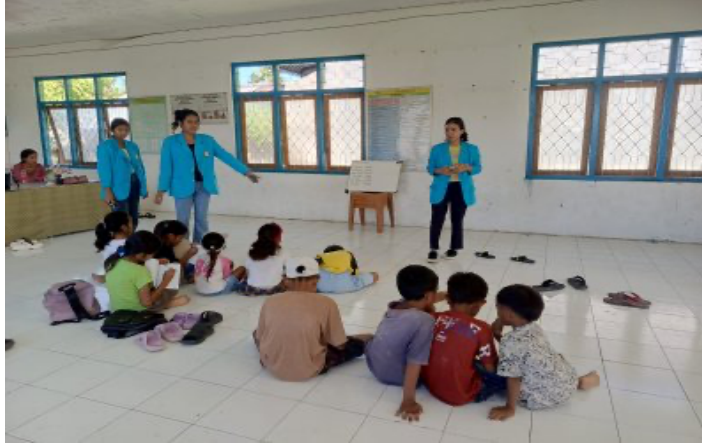
Gambar 2. Pelaksanaan Kegiatan Bimbingan Belajar