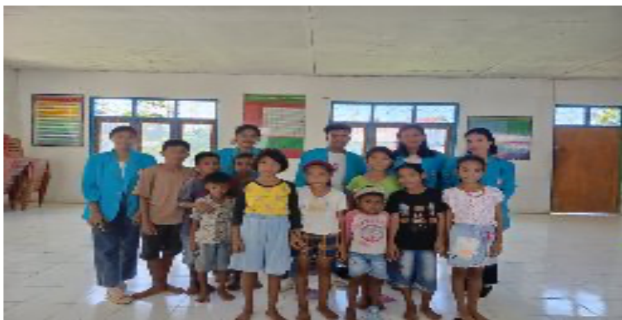
Gambar 3. Penutupan Kegiatan Bimbingan Belajar

Dari pelaksanaan program bimbingan belajar di sekolah dasar, terlihat jelas bahwa kesadaran dan kualitas kognitif siswa dapat di tingkatkan dan di maksimalkan melalui sesi bimbingan belajar yang intensif dan tatap muka. Hal ini lebih mempersiapkan siswa untuk menghadapi model pembelajaran online, yang menekankan pada pembelajaran mandiri di rumah. Pengenalan program bimbingan belajar ini juga membuat anakanak sekolah dasar lebih mudah dan lebih fleksibel untuk mengajukan pertanyaan dan menerima saran langsung dari mahasiswa sebagai pembimbing untuk membantu pekerjaan mandiri mereka.